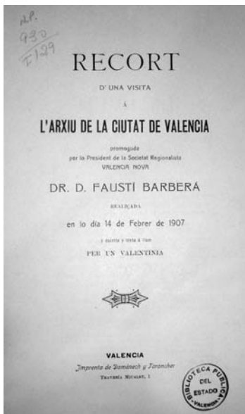
Portada del Recort d'una visita a l'Arxiu de la ciutat de València (1907).

propi, sinó com «Un fill de la terra amant de sant Vicent Ferrer, de la seua llengua i de la pública honestat» 26 . Finalment, resulta lògic que, tractant-se d'una activitat promoguda i encapçalada per ell, considerara que –per una qüestió de pudor– era millor amagar la identitat de l'autor de la ressenya darrere d'un pseudònim. Perquè, altrament, podria semblar autobombo.