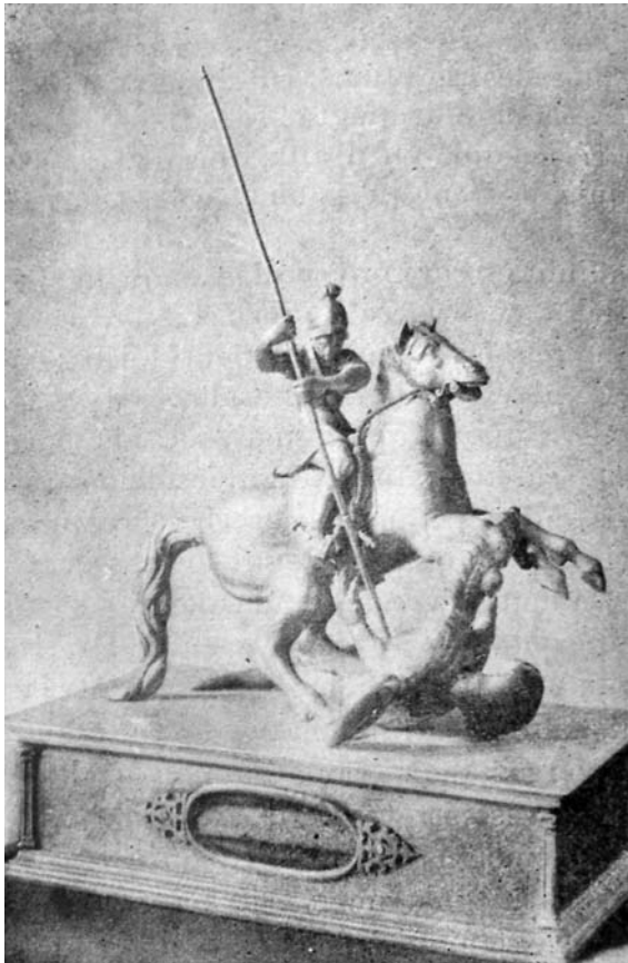
Reliquiari de Sant Jordi conservat a l'Arxiu municipal de València. És d'argent i davant d'ell feien el jurament els jurats de la ciutat.

Entre «lo principalment anotat y contemplat», l'autor hi destacava dues senyeres: la reial, «eixe emblema de l'pàtria», i la de la conquesta, enarborada «quant València caigué'n mans de lo gran conqueridor en l'any 1238». Així mateix, i «per a no pasar per alt ninguna de les banderes guardades per la ciutat», també s'hi citava «lo pendó de Castella», del qual l'autor únicament deia que li recordava «l'època de la decadència del dret valencià, quant, abolits los Furs, als desgraciats habitants de nostra regió no'ls quedava tan sols lo dret de demanar».