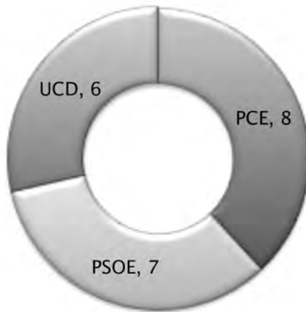
Gràfic 1. Eleccions locals 1979. Elaboració pròpia.