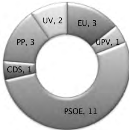
Gràfic 4. Eleccions locals 1991. Elaboració pròpia.

A aquesta primera etapa d'Adrián Hernández García el número de votants va ser d'11.381 amb una participació del 62,8%. Una dada que cal destacar és l'abstenció d'un 37,2% de ciutadans que van decidir no exercir el seu dret al vot. El número de vots emesos va ser d'11.381, es validaren 11.321. A aquest Plenari tan heterogeni es poden identificar els següents partits polítics amb representació: PSOE 5.534 i 11 regidors, PP amb 3 regidors i 1.806 vots, EU 1.435 i 3 regidors, UV amb 2 regidors i 996 vots, CDS 750 vots i 1 regidor, i finalment UPV amb 1 regidor conseqüència de 673 vots.