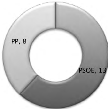
Gràfic 8. Eleccions locals 2007. Elaboració pròpia