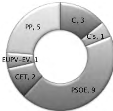
Gràfic 10. Eleccions locals 2015. Elaboració pròpia.

Els partits polítics amb representació al Plenari van ser els següents: PSPV 5.868 vots amb un 36,96%, PP amb 21,96% i 3.486 vots, COMPROMÍS 2.184 vots i 13,76%, CET amb 1.753 vots i un 11,04%, C's amb un 6,82% i 1.083 vots, EUPV-EV: AC 963 vots i un 6,07% del vots.