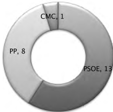
Gràfic 9. Eleccions locals 2011. Elaboració pròpia.