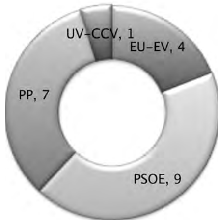
Gràfic 5. Eleccions locals 1995. Elaboració pròpia.

estar els següents: PSOE 5.430 vots i 9 regidors, PP amb 7 regidors i 4.078 vots, EU-EV 2.735 vots i 4 regidors, UV-CCV amb 1 representant i 1.128 vots.