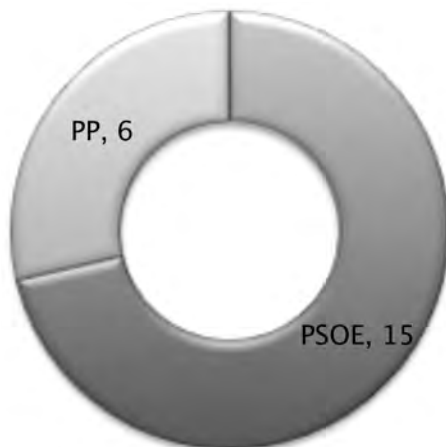
Gràfic 7. Eleccions locals 2003. Elaboració pròpia.