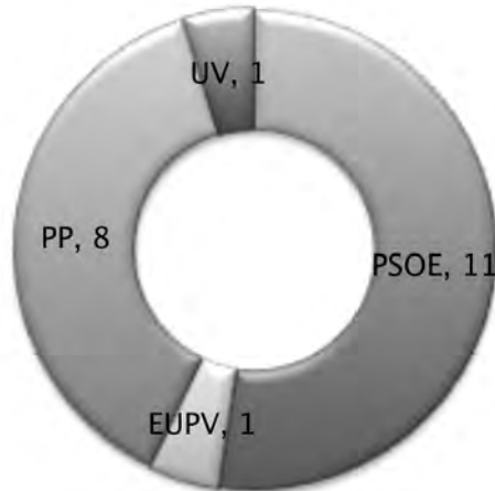
Gràfic 6. Eleccions locals 1999. Elaboració pròpia.

Del resultat electoral de 1999 es desprèn la tornada als resultats electorals de 1991 amb 11 regidors. A aquest període, ja consolidada la democràcia, continua havent una abstenció significativa, amb un 38,4%, 8.295 es van abstenir de votar. El número de votants va ser de 13.286, sent vàlids 13.185 vots. Els resultats van ser els següents: PSOE 6.220 i 11 regidors, PP amb 8 regidors i 4.794, EUPV 1.082 i 1 regidor, UV amb 1 regidor i 797 vots.