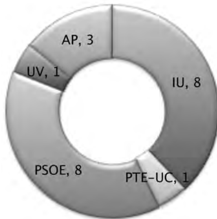
Gràfic 3. Eleccions locals 1987. Elaboració pròpia.

La configuració del Plenari va ser la següent: PSOE 4.218 amb 8 regidors, IU 3.994 i 8 regidors, AP 1.648 amb 3 regidors, UV 827 i 1 regidor, Partit dels Treballadors d'Espanya-Unitat Comunista (PTE-UC) 1 regidor amb 721 vots. Centre Democràtic i Social (CDS) i Unificació Comunista d'Espanya (UCE) van obtenir 546, 4,53% i 98 vots, 0,81%, respectivament quedant sense representació al Plenari.